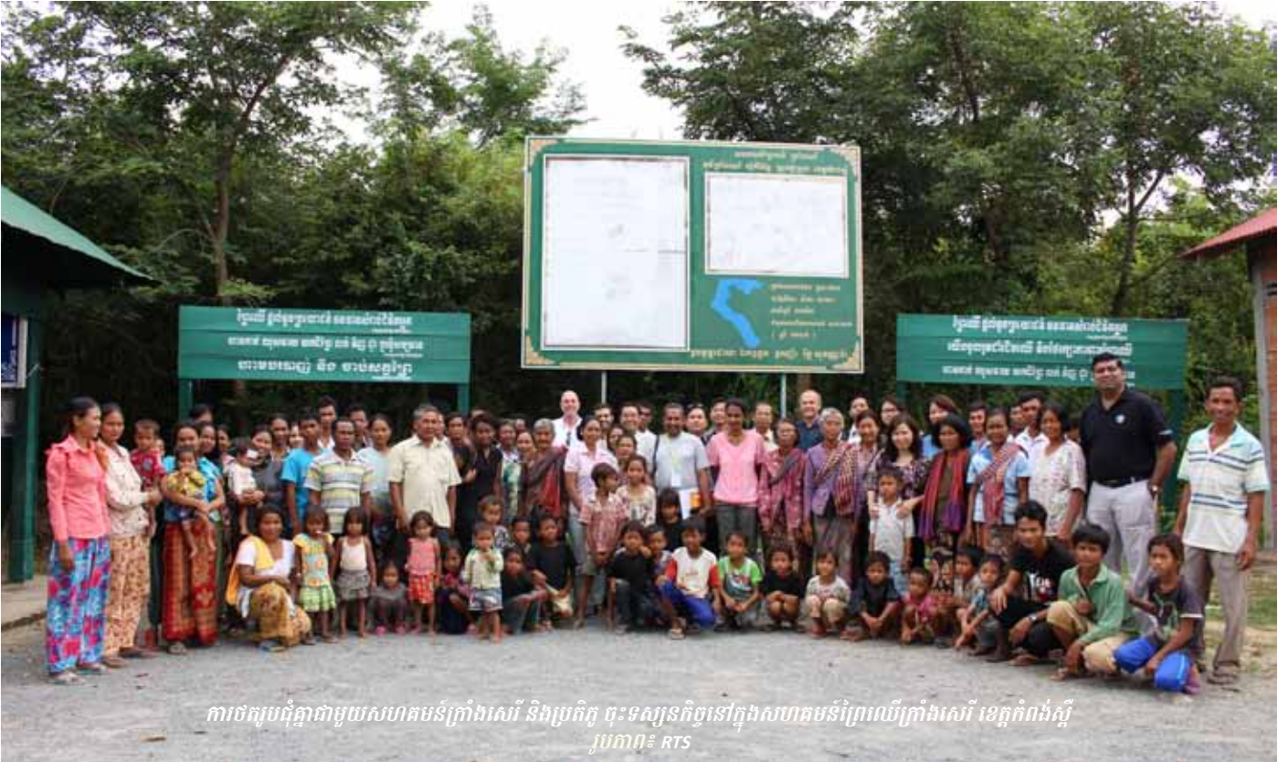
ការចុះកម្រិតជាមួយសហគមន៍ក្រាំងសេរី និងប្រតិភូ ចុះទស្សនកិច្ចនៅក្នុងសហគមន៍ព្រៃឈើក្រាំងសេរី ខេត្តកំពង់ស្ពឺ

ពីថ្ងៃទី៣០ ខែតុលា ដល់ថ្ងៃទី០១ ខែវិច្ឆិកា ឆ្នាំ២០១៣ ប្រតិភូបីក្រុមមកពីប្រទេស ភូមា ស្រីលង្កា និងវៀតណាម បានធ្វើទស្សនកិច្ចមកកម្ពុជាដើម្បីសិក្សារៀនសូត្រ ដកបទពិសោធន៍ អំពីភាគីចូលរួមពាក់ព័ន្ធ និងការទំនាក់ទំនងនៅកម្ពុជា និងដើម្បីផ្លាស់ប្តូរបទពិសោធន៍ពីគ្នាទៅវិញទៅមក។ ប្រតិភូមួយចំនួនទៀត គឺបានអញ្ជើញមកពីប្រទេសនេប៉ាល់ ប៉ាគីស្ថាន និងប៉ាពួញូហ្គីនី។