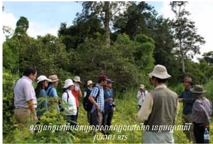
ទស្សនកិច្ចទៅតំបន់គម្រោងសាកល្បងនៅសីម៉ា ខេត្តមណ្ឌលគីរី