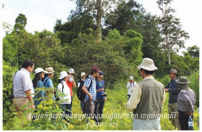
ទស្សនកិច្ចទៅតម្រូវគ្រោងសាកល្បងនៅសីម៉ា ខេត្តមណ្ឌលគិរី