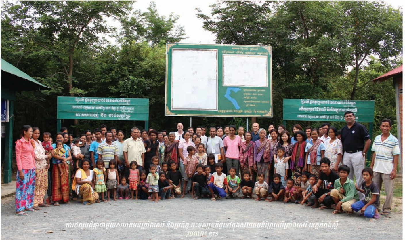
ការចុះមេដឹកនាំមួយសហគមន៍ក្រៅរដ្ឋ និងប្រតិភូ ចុះទស្សនកិច្ចនៅក្នុងសហគមន៍ព្រៃឈើក្រាំងសើរ ខេត្តកំពង់ស្ពឺ ប្រមាណ៖ ៩៣

ពីថ្ងៃទី៣០ ខែតុលា ដល់ថ្ងៃទី០១ ខែវិច្ឆិកា ឆ្នាំ២០១៣ ប្រតិភូបីក្រុមមកពីប្រទេស រុក្ខា ស្រីលង្កា និងវៀតណាម បានធ្វើទស្សនកិច្ចមកកម្ពុជាដើម្បីសិក្សារៀនសូត្រ ដកបទពិសោធន៍ អំពីភាគីចូលរួមពាក់ព័ន្ធ និងការទំនាក់ទំនងនៅកម្ពុជា និងដើម្បីផ្លាស់ប្តូរបទពិសោធន៍ពីគ្នាទៅវិញទៅមក។ ប្រតិភូមួយចំនួនទៀត គឺបានអញ្ជើញមកពីប្រទេសនេប៉ាល់ ប៉ាគីស្ថាន និងប៉ាពួញូវីនី។