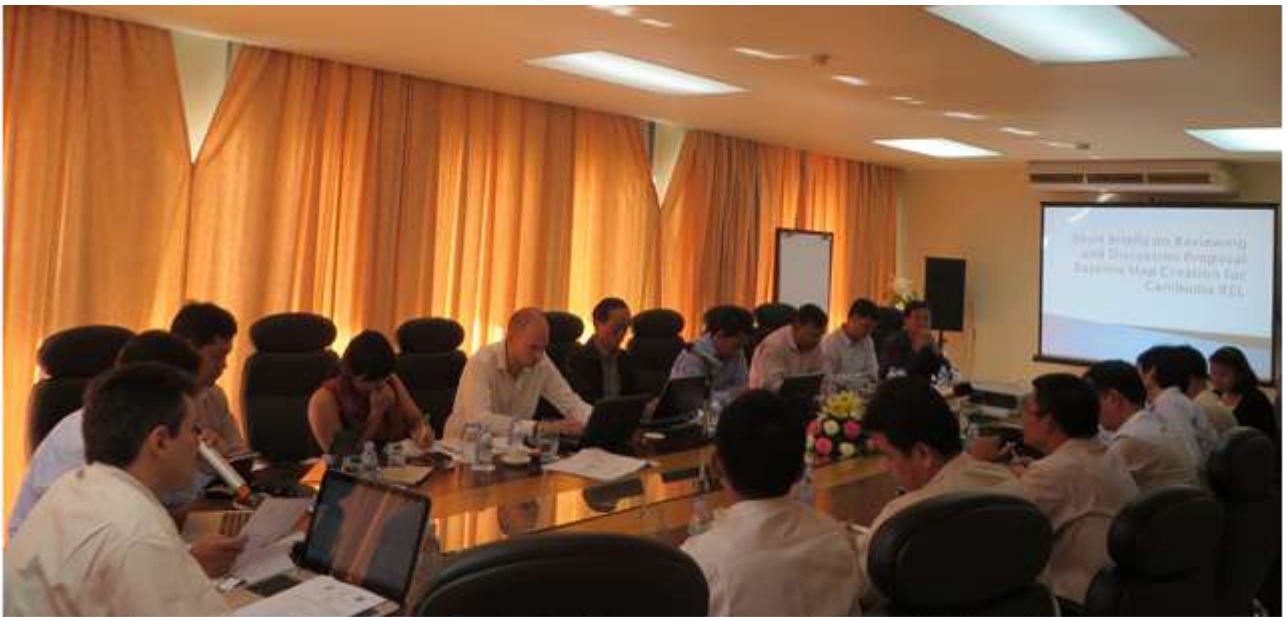
©Figure 1: Photo of Special MRV TT Meeting 24-26 July 2014 at Independence Hotel, Sihanouk Ville