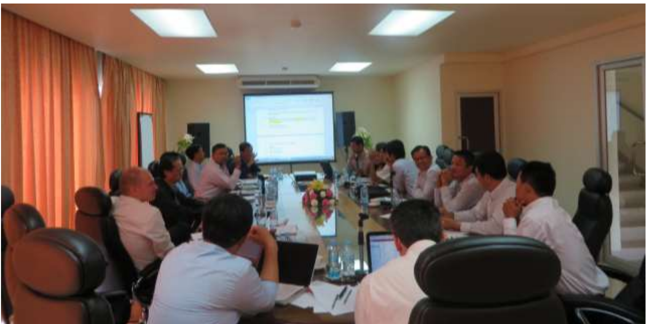
©Figure 1: Photo of Special MRV TT Meeting 24-26 July 2014 at Independence Hotel, Sihanouk Ville